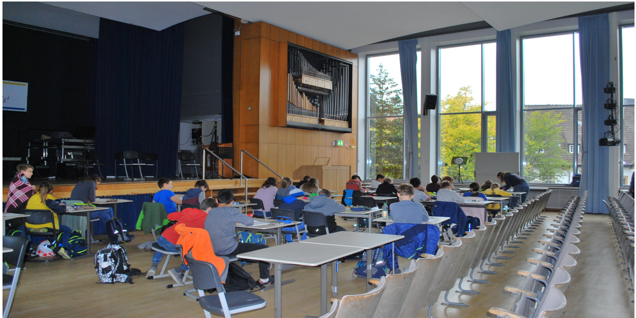
Abbildung 1: Gemütlich in der Aula mit Kuscheldecke