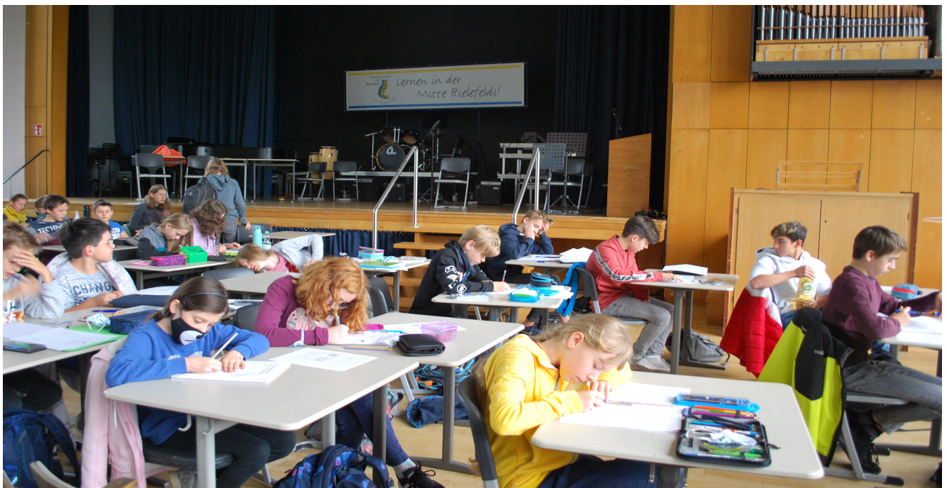
Abbildung 2: Dreht sich da jemand um?